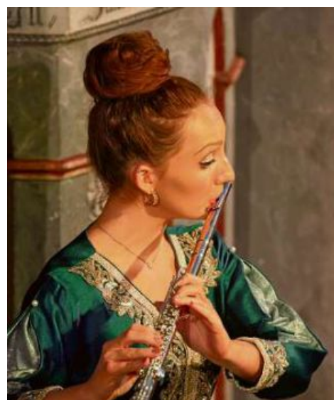
Immer wieder gern gehört werden auch virtuose Instrumentalistinnen.

Vieles ist bewusst gleich geblieben und das schätzen und wünschen die Vereinsmitglieder und wiederkehrenden Besucher meines Erachtens auch. Es ist grundsätzlich immer das gleiche Konzept mit